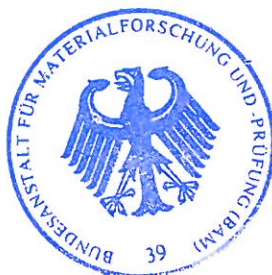
Dipl.- Ing. B.-U. Wienecke

Zulassung und Verwendung Im Auftrag / For