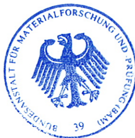
Dipl.- Ing. B.-U. Wienecke

Arbeitsgruppe Zulassung und Verwendung Im Auftrag / For